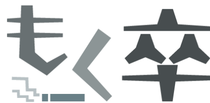
エムステージグループの禁煙支援制度

喫煙者のみならず、非喫煙者に向けた制度も取り入れることで、全社員の健康増進を目指しています。